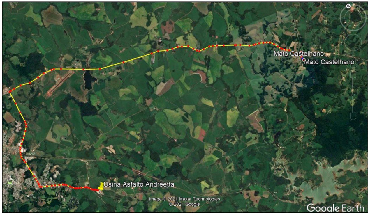
Croqui de localização Usina C.B.U.Q. e pedreira ANDREETTA Sem Escala

USINA C.B.U.Q. E PEDREIRA ANDREETTA LOCALIZADA EM PASSO FUNDO, DISTANTE 27,00 KM DA OBRA NO MUNICÍPIO DE MATO CASTELHANO.