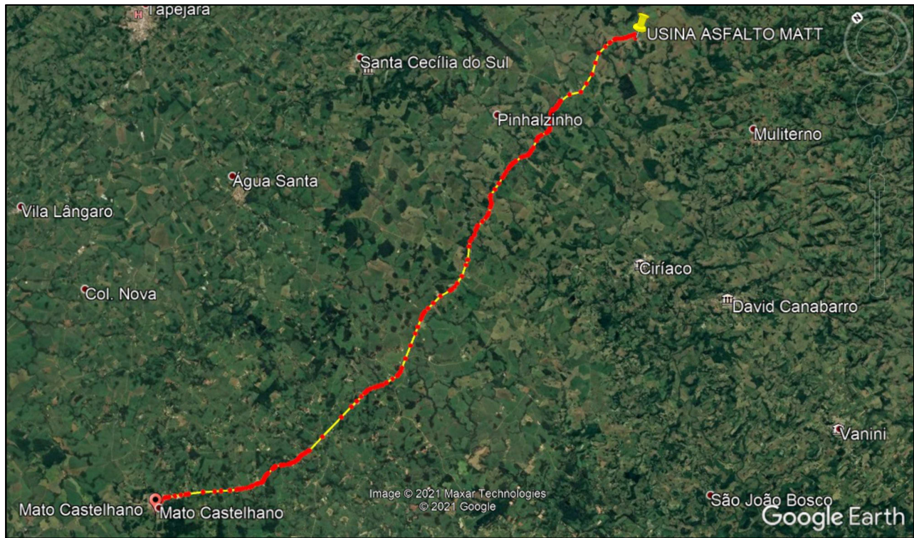
Croqui de localização Usina C.B.U.Q. e pedreira MATT Sem Escala

USINA C.B.U.Q. E PEDREIRA MATT LOCALIZADA EM CASEIROS, DISTANTE 44,00 KM DA OBRA NO MUNICÍPIO DE MATO CASTELHANO.