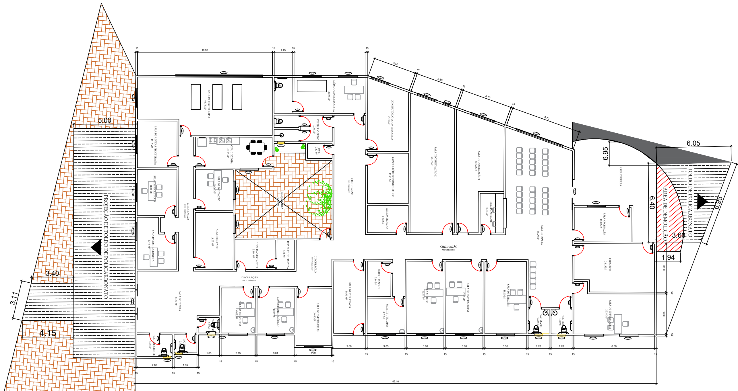
PLANTA BAIXA COM AREA DE REFORMA